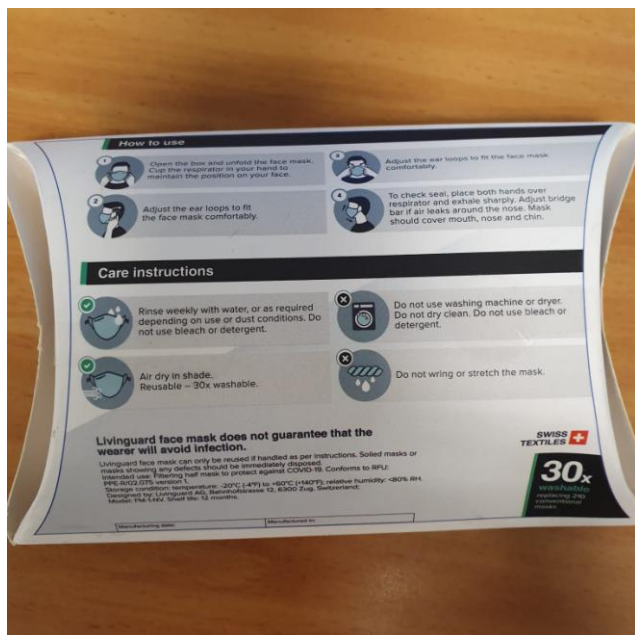
אריזה (צד אחורי)